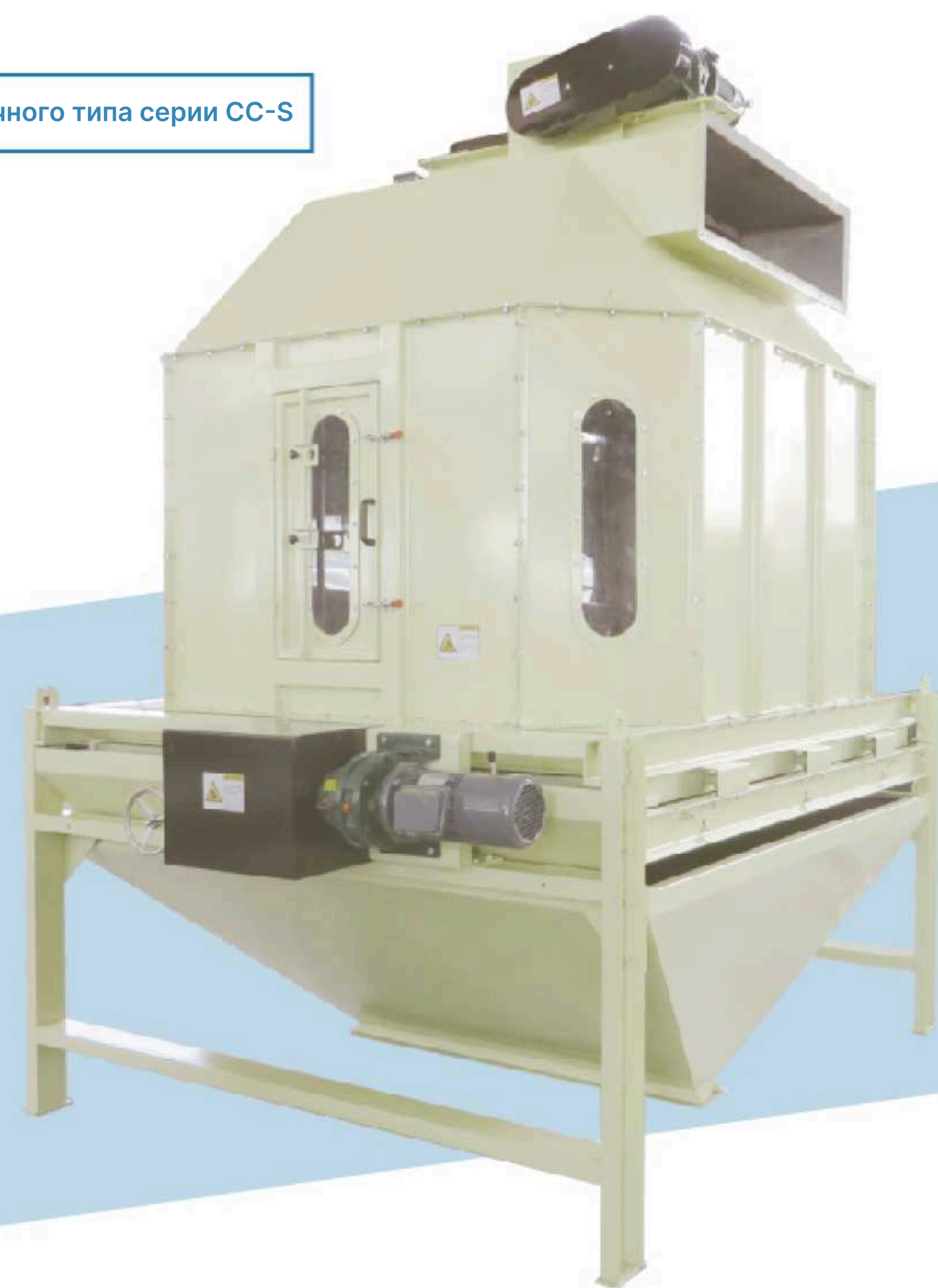
Охладитель противоточного типа серии CC-S