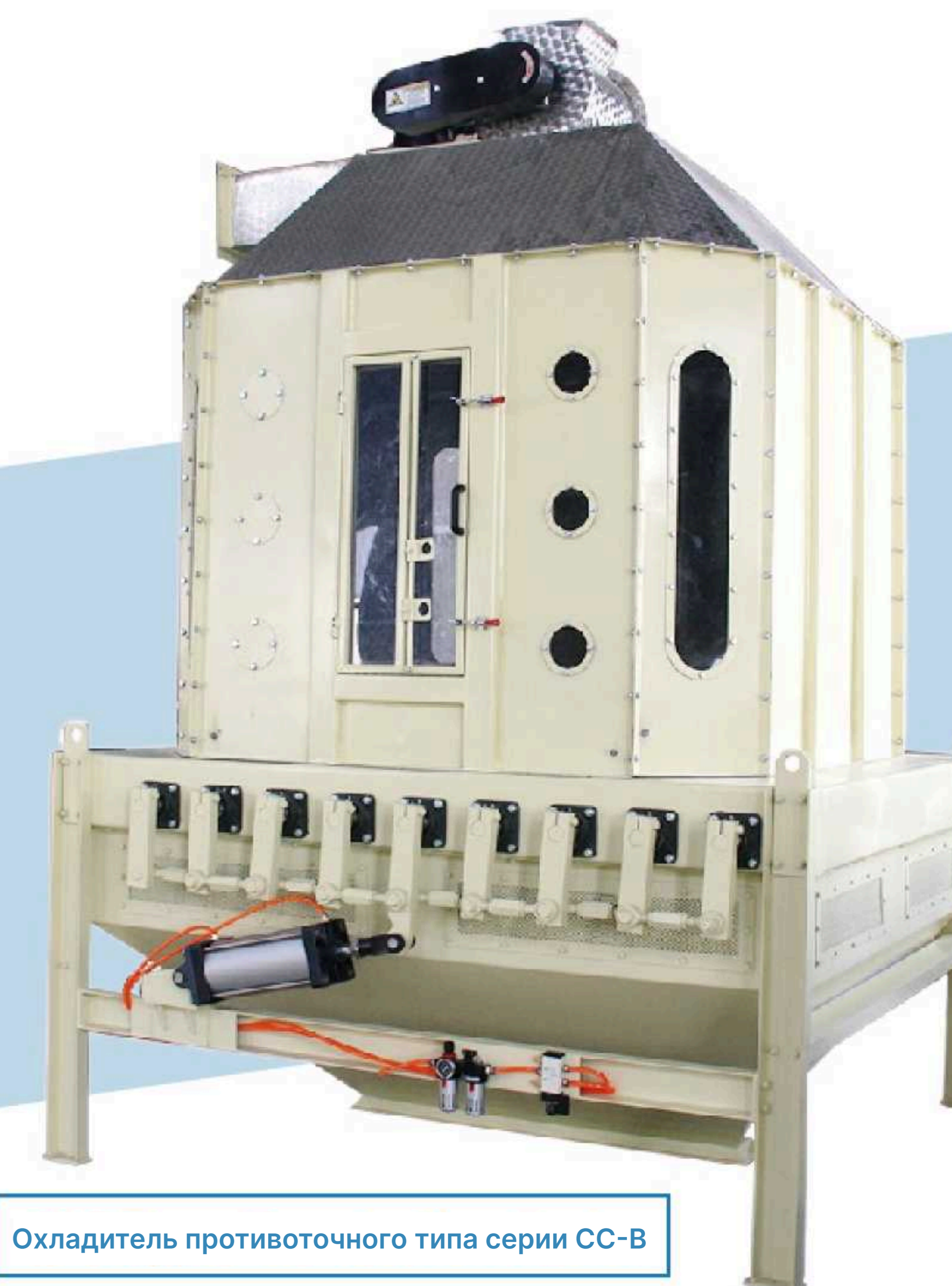
Охладитель противоточного типа серии CC-B