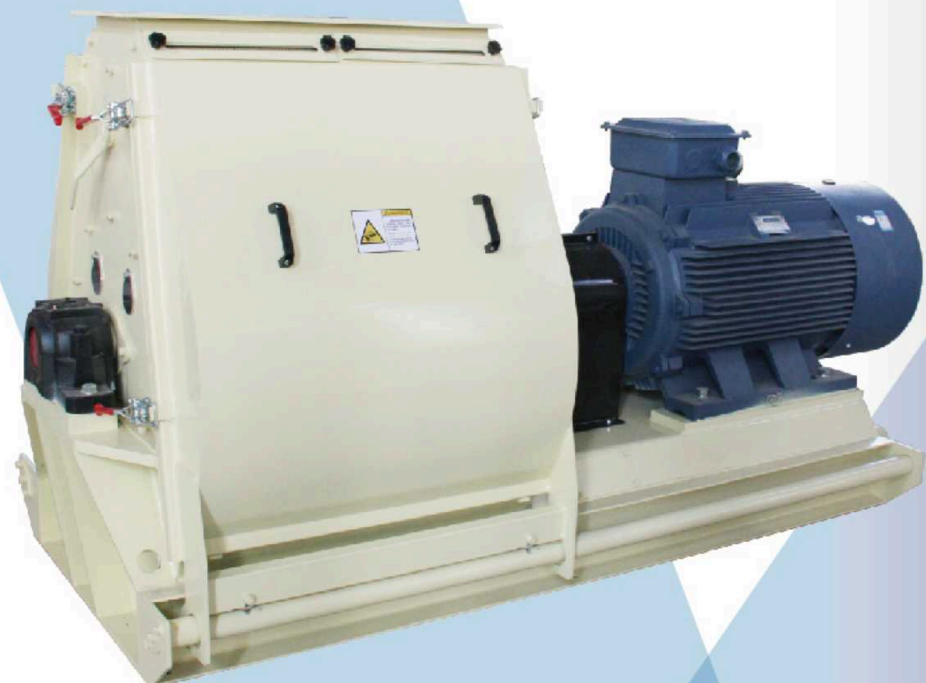
Молотковые дробилки типа HM65

Правильная комбинация типа молотковой дробилки, сит, молотков, скорости, системы подачи и воздушного потока через дробилку обеспечивает необходимое качество измельчения и создаёт оптимальные условия для последующих процессов, таких как смешивание, гранулирование и экструзия. Таким образом, процесс измельчения — это не просто вопрос выбора молотковой дробилки, а целая система, включающая всё: от подающей системы до разгрузочного бункера, фильтра аспирации и электронной системы управления.