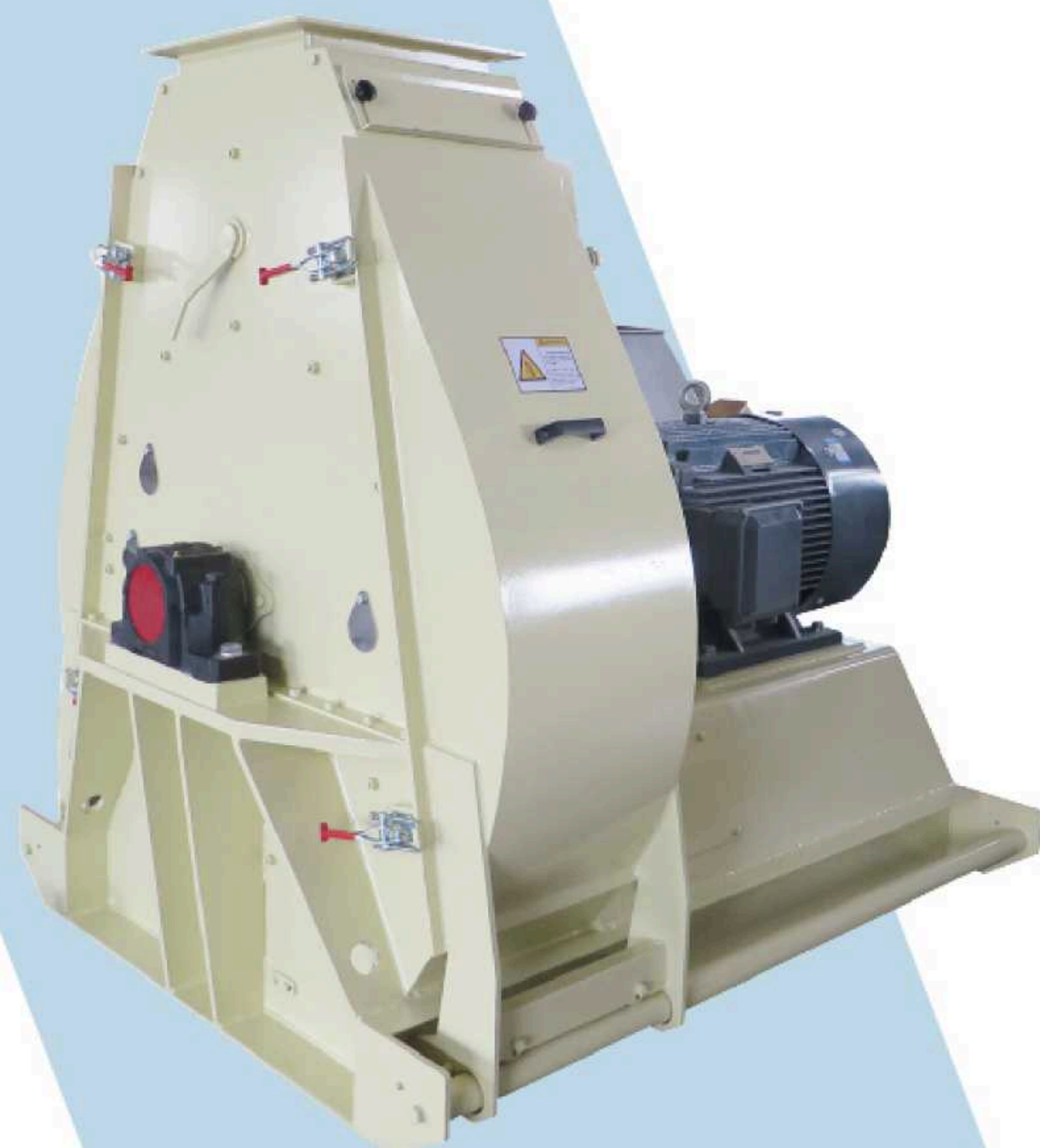
Молотковые дробилки типа HM120